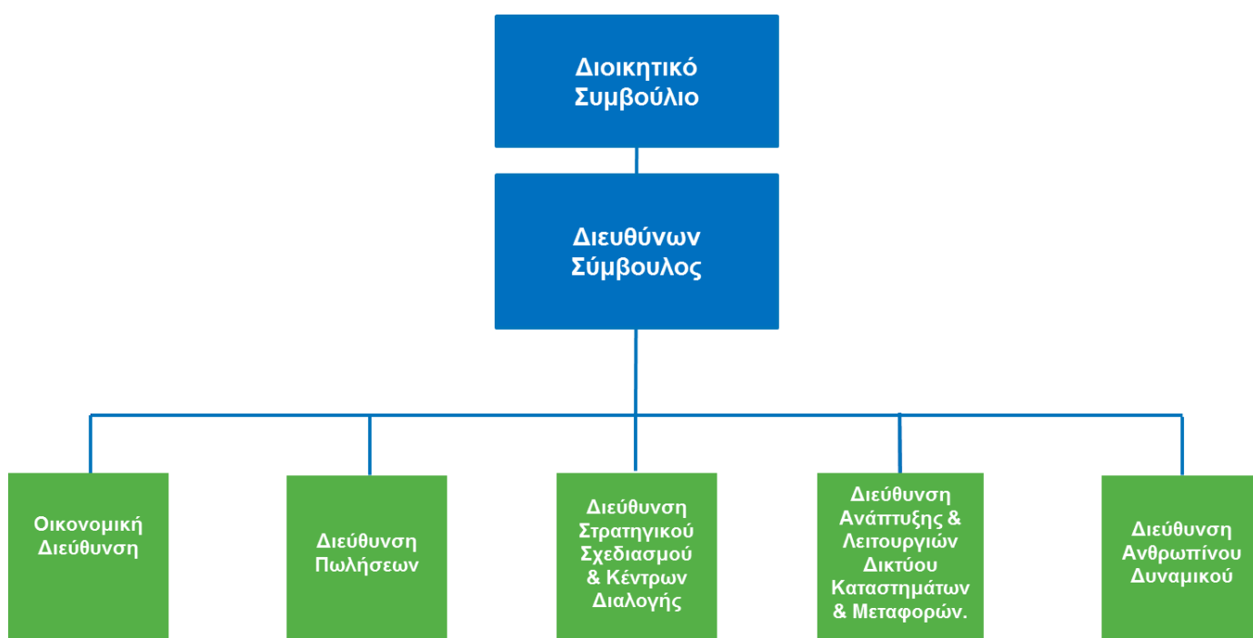
Σχήμα 1: Οργανόγραμμα SPEEDEX